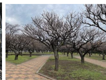
うめのき憩いの森