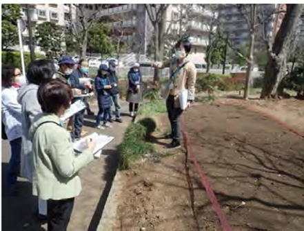
実習地と周辺環境を調査しました