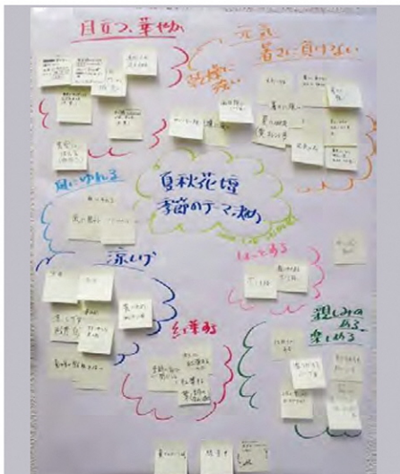
受講生からの季節のテーマ案

講座では、花壇をとりまく環境について、意見を出し合いました。これから実習を通して、みんなで花壇をつくっていきます。