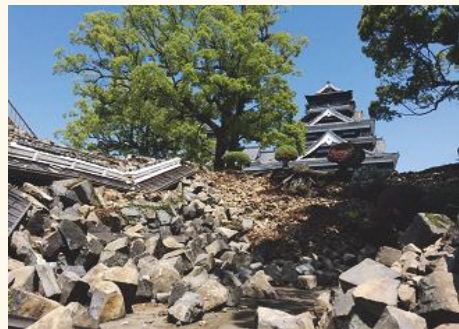
熊本県のご協力による「震災パネル展」もあります！