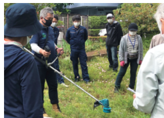
刈払機実習の様子

労働局の登録教習機関として、刈払機の使い方をはじめとした、安全に作業を行うための技能講習や安全衛生教育を行っています。